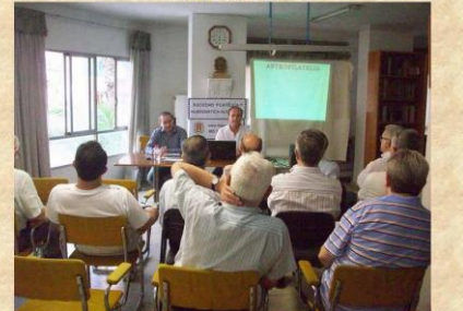
2 de Junio de 2012 Local Sociedad Filatélica de ALICANTE